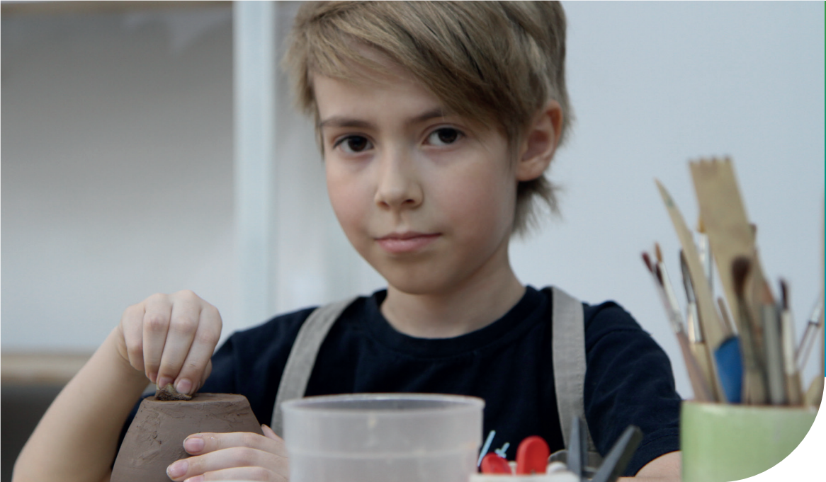
Bishkek, Kyrgyzstan

창조적인 사람들은 상상력이 풍부합니다. 창조적인 아이들은 세상을 보는 눈이 단순하고 선하며 훌륭한 것을 만들 수 있는 능력이 있습니다. 글로벌호프 키르기스스탄 문화센터에서 다양한 교육 프로그램을 통해 아동이 주체가 되어 스스로 배움과 성장을 경험하여 각 개인이 가진 고유의 가치를 발견하고 세상에서 발휘할 수 있도록 희망을 지원합니다.